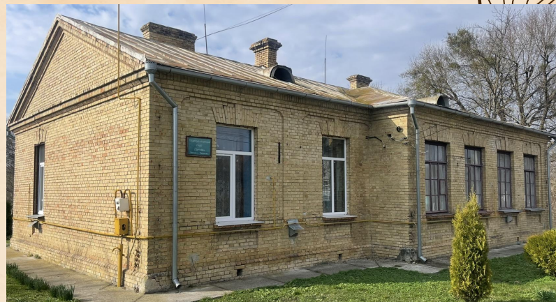
Приміщення чеської школи с. Мартинівка 1920-х рр. Зараз: акушерсько-фельдшерський пункт с. Мартиніка