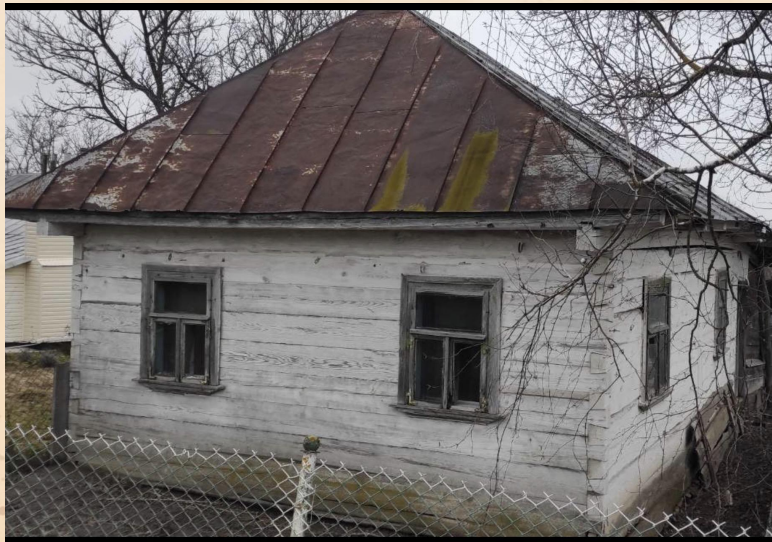
Традиційна українська поліська хата поч. XX ст. Село Дроздів, Рівненська обл.