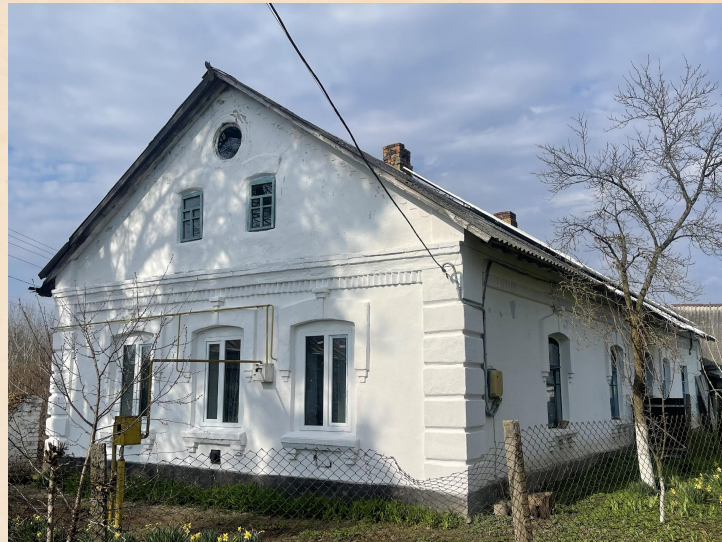
Чеська хата кін. XIX ст. с. Грушвиця Перша