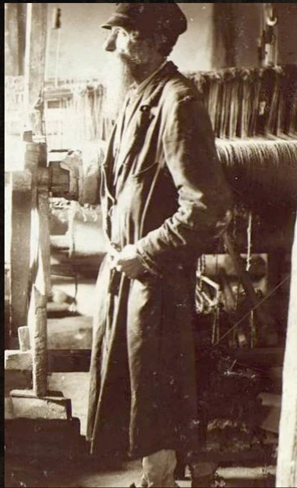
Ткач талесів (95 років). Місто Шепетівка Заславського повіту на Волині (тепер село у Шепетівському районі Хмельницької області). 1912 рік

Єврейська громада була економічним каркасом Шепетівки. Окрім торгівлі, євреї-підприємці активно володіли паровими млинами, продукція яких експортувалася навіть до Пруссії, та виступали фахівцями на цукроварнях. Разом із цим Шепетівка мала статус штетлу, що сформувало унікальну забудову: щільні єврейські будинки межували з українськими садибами.