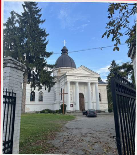
Костел Успіння Пресвятої дівки Марії. Сучасний вигляд