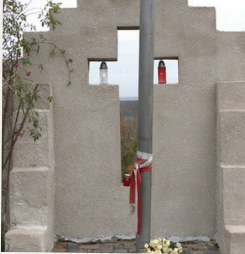
Братня могила польських воїнів. Сучасний вигляд