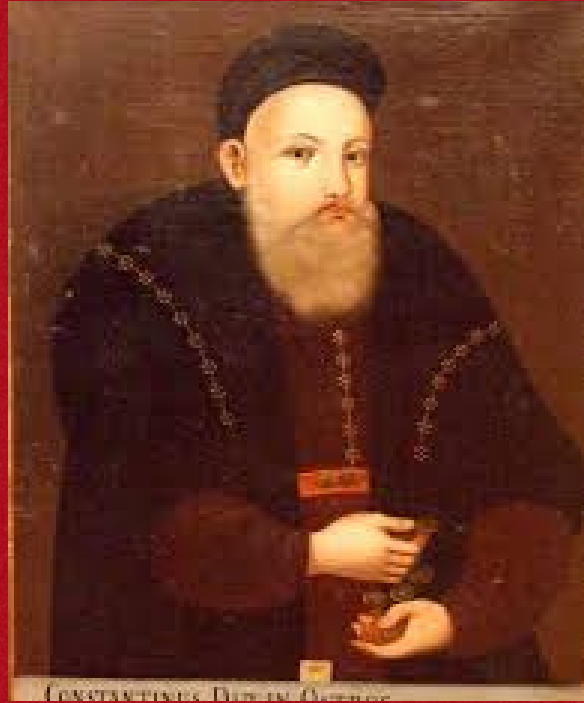
Князь К.-В. Острозький

Поява та «Золота доба»: активне заселення міста поляками розпочалося після Люблінської унії 1569 р. Князі Острозькі залучали польських ремісників та торговців, забезпечуючи умови для розбудови костелів та освітніх осередків.