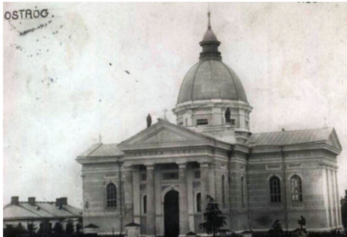
Костел Успіння Діви Марії 1930-х рр.

«Нові поляки»: на зміну вивезеним мешканцям прибули поляки, депортовані в Казахстан у 1930-х рр. саме вони стали основою сучасної громади, зберігши традиції та віру.