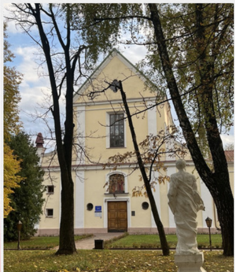
Колишній монастир Капуцинів. Сучасний вигляд