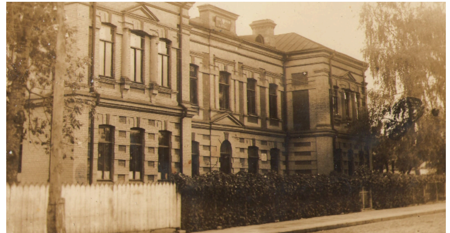
Польська школа ім. С таніслава Сташицишина 1930-х рр.