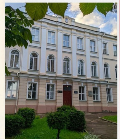
Острозький ліцей №2. Сучасний вигляд