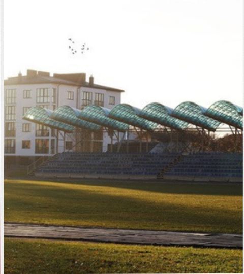
Стадіон Острозької Акажемії. Сучасний вигляд