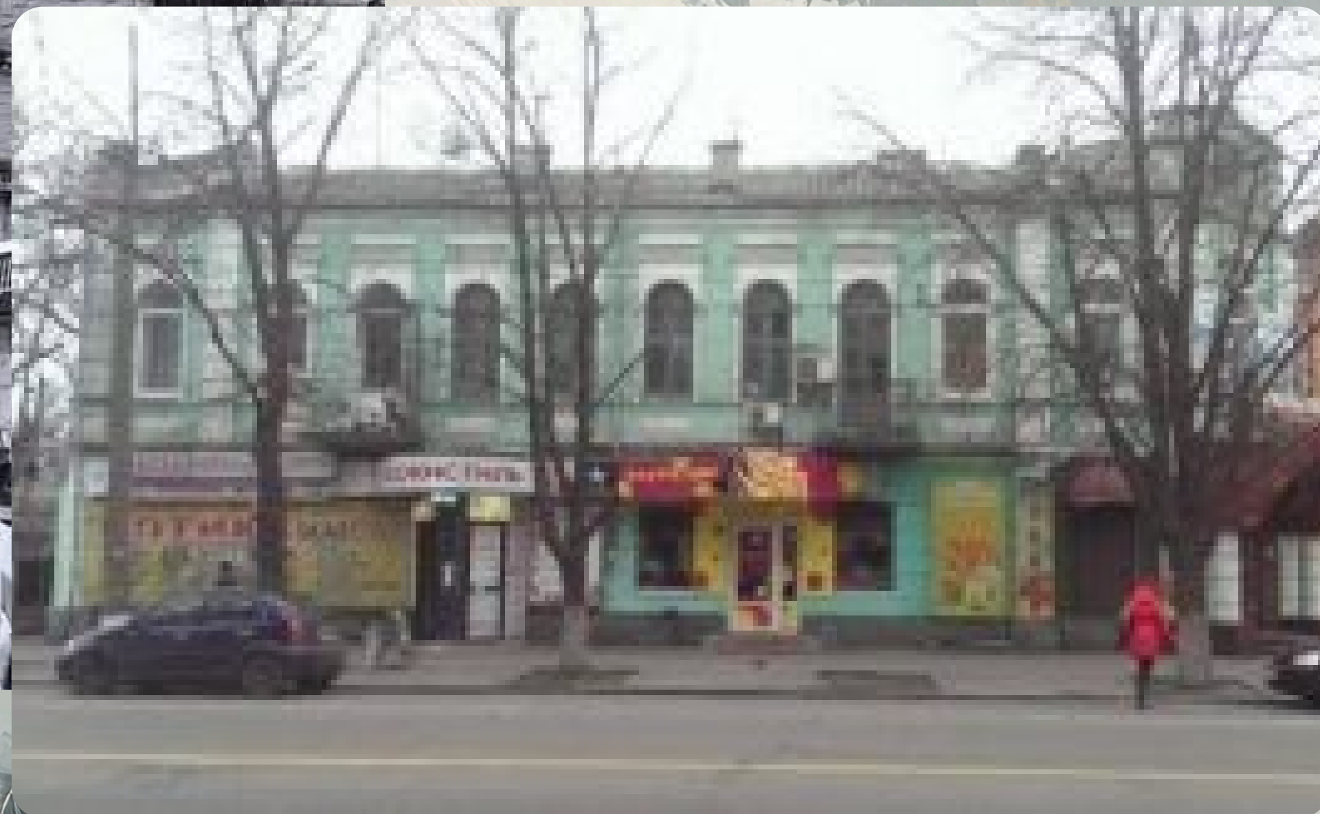
Сучасний вигляд будівлі