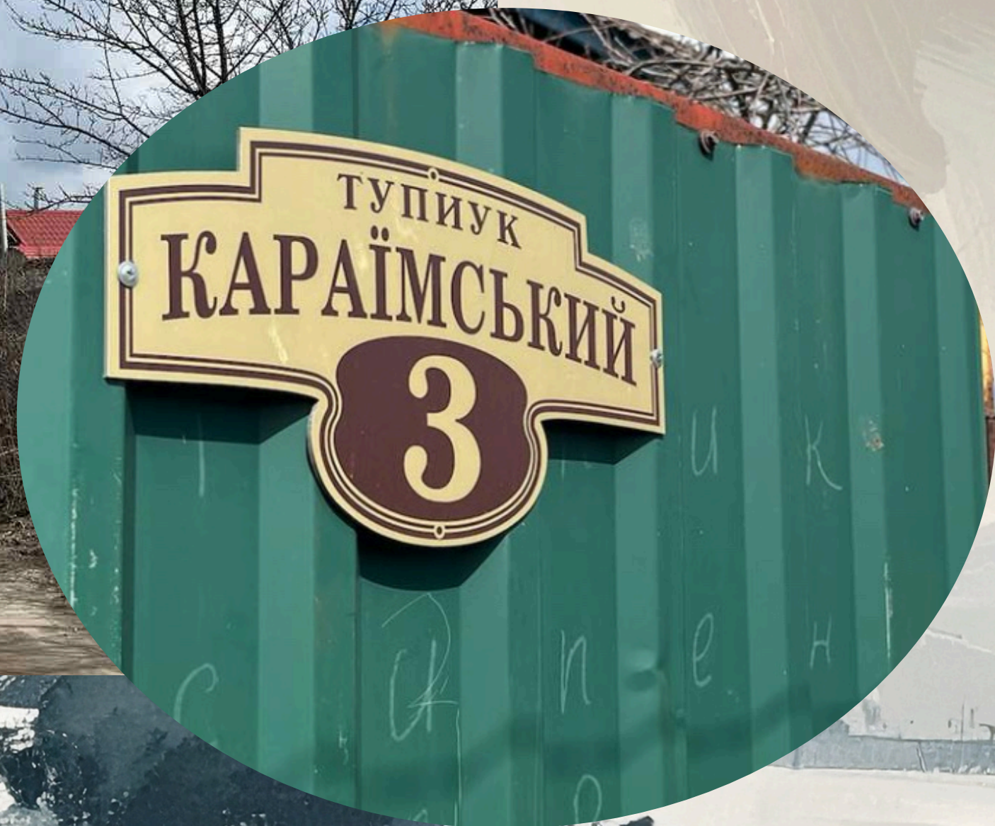
Тупик Караїмський у м. Кременчук.