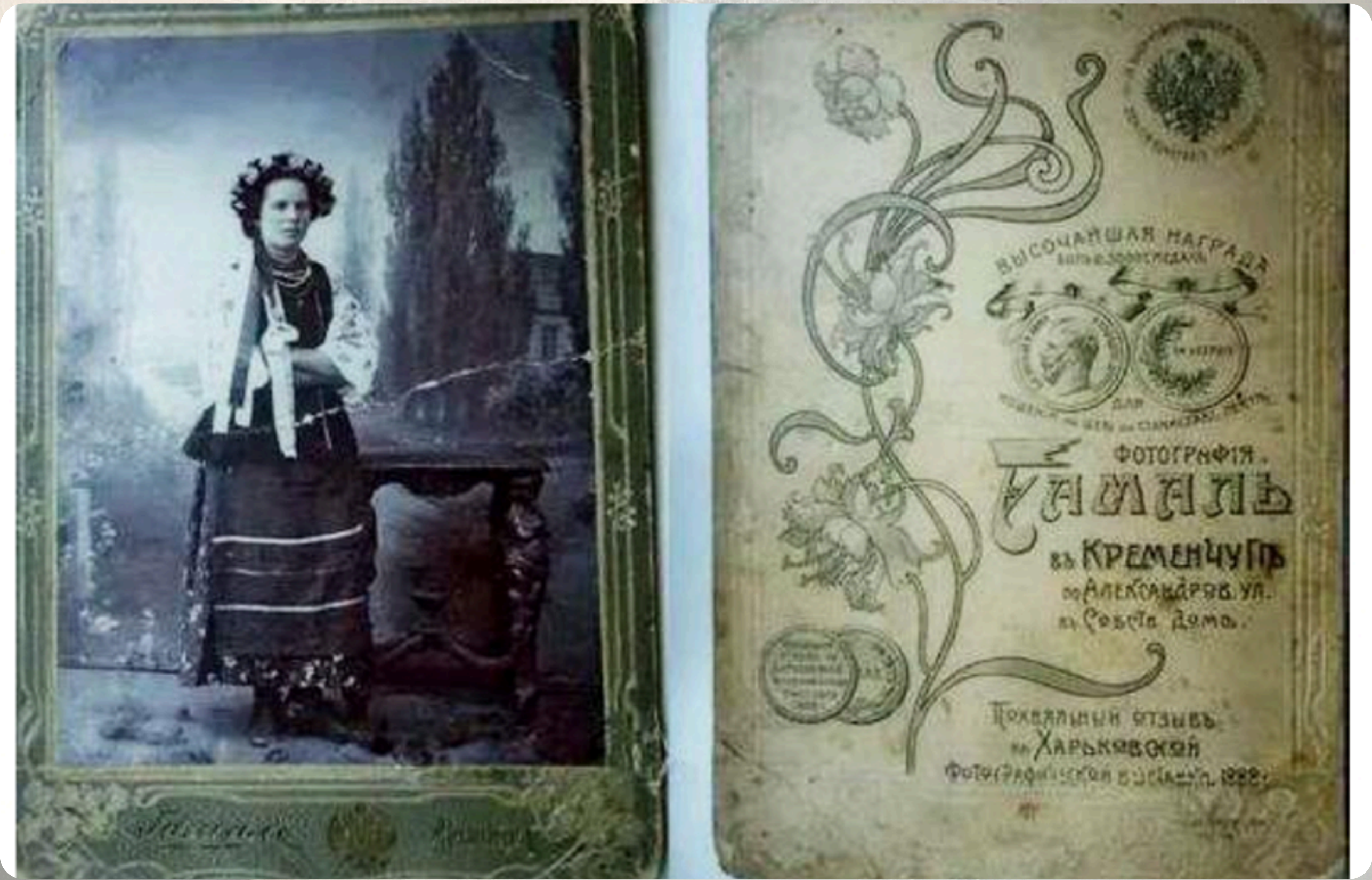
Юфуда Гамаль. Світлина «Українка». 1888 р.