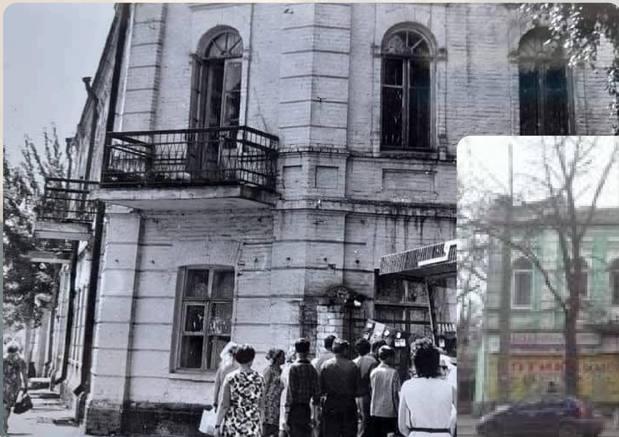
Будівля фотоательє Юфуда Гамалє «Російська фотографія». Фото 70-х років ХХ ст.