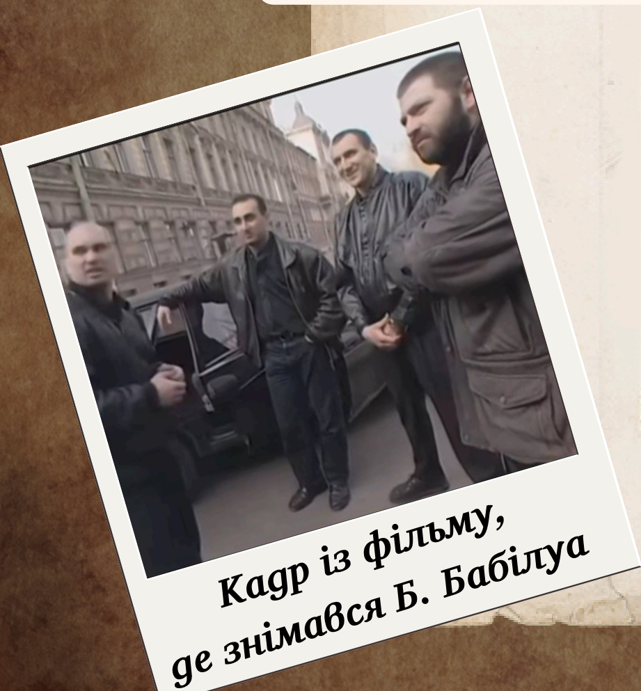
Кадр із фільму, де знімався Б. Бабілуа