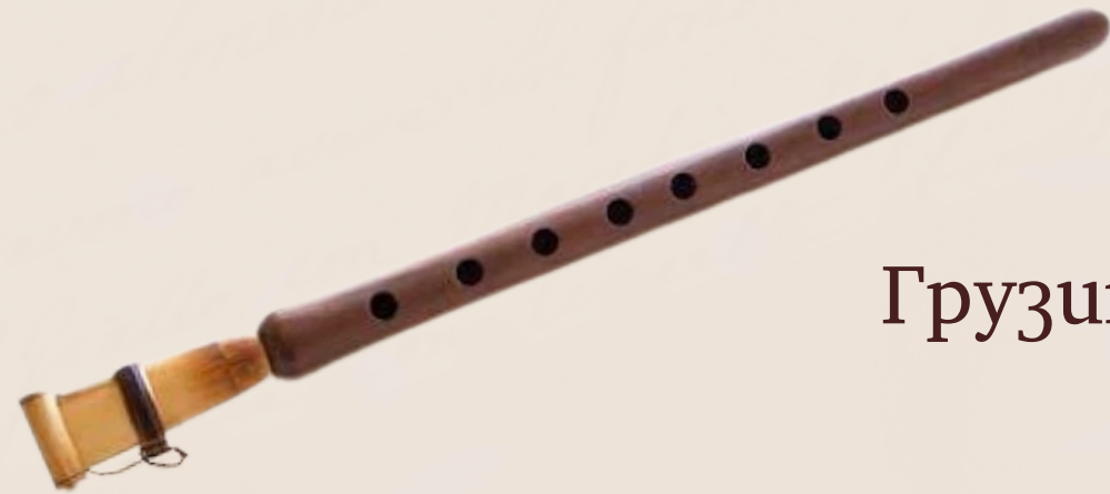
Грузинська гармоніка 45.5%