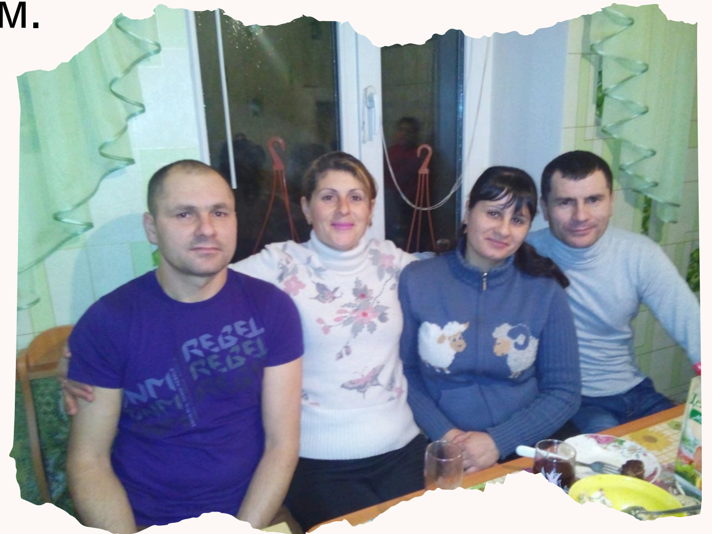
Мій тато зі своїми сестрами та братом

Тато зі своїм братом прийшли до своєї сестри з плугом і заспівками.