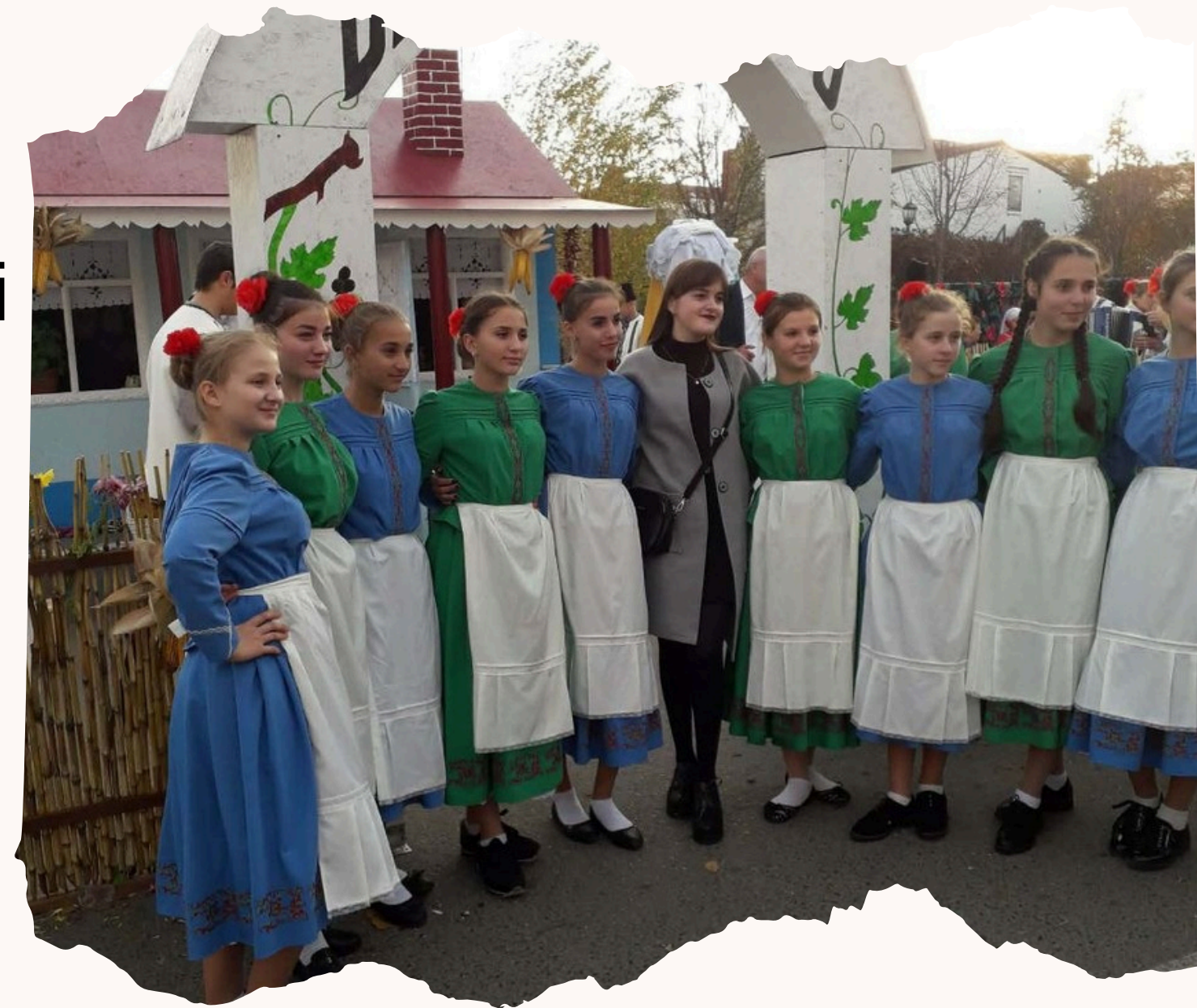
Фото мої сестри у народних вбраннях

Для них дуже важливо відзначати це свято та наслідувати свої традиції.