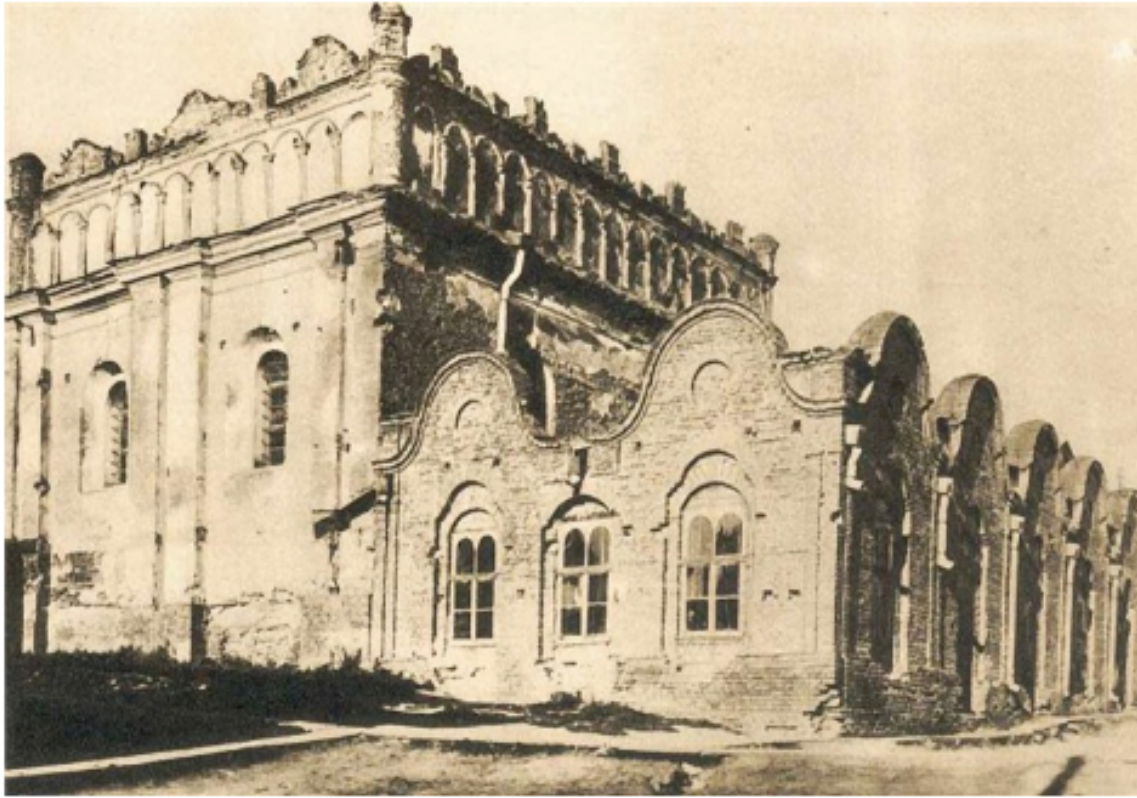
Синагога ХХ ст.