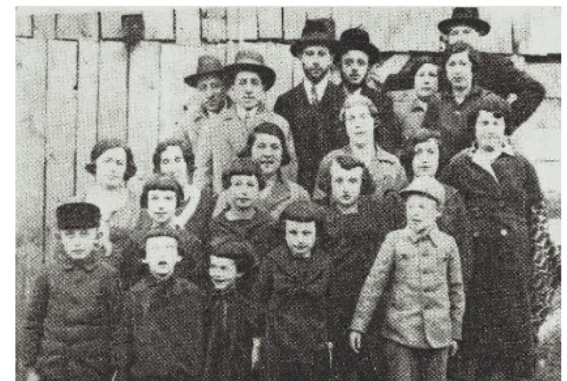
Єврейський квартал 20-ті роки ХХ ст.