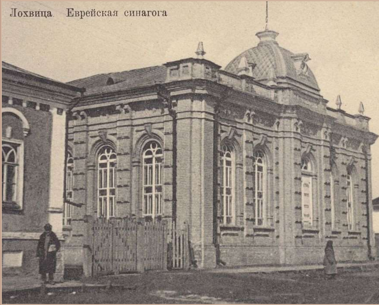
Лохвица. Еврейская синагога