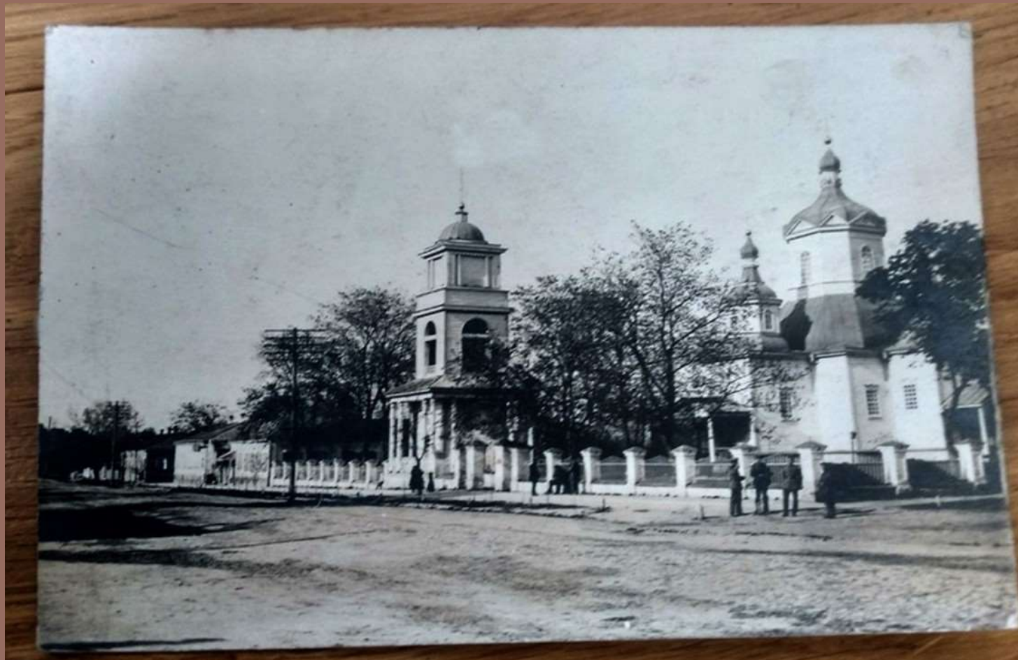
ПОШТОВА ЛИСТІВКА 1900 РОКІВ